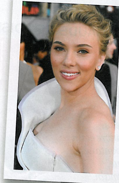
APRÈS On adore!